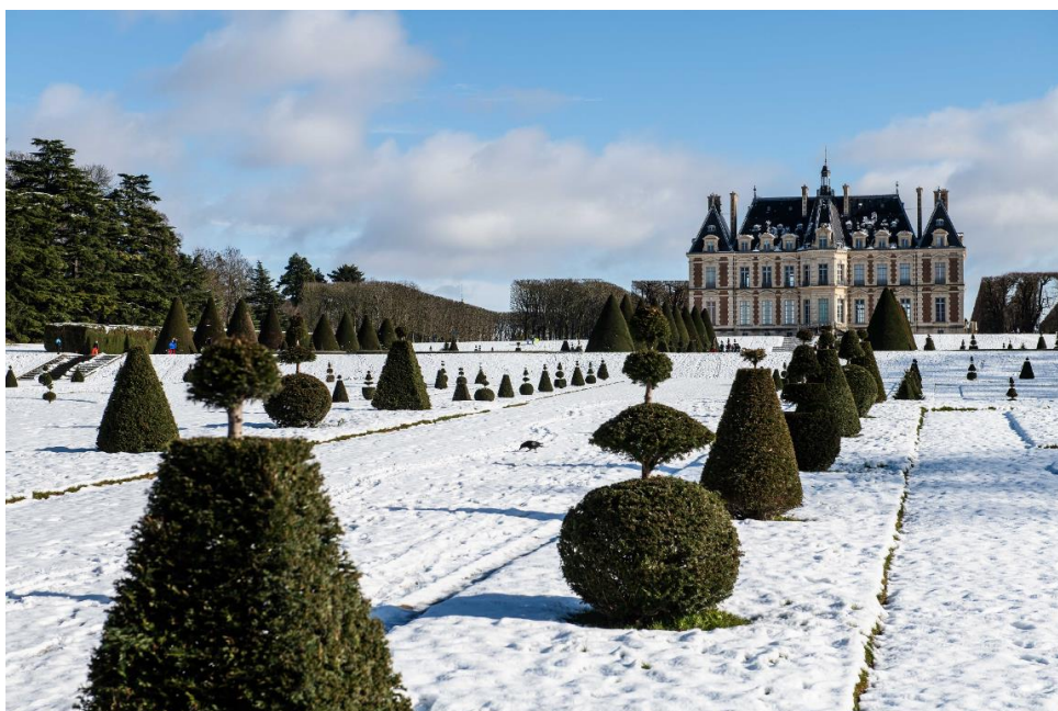
Le Château du Domaine départemental de Sceaux sous la neige en janvier 2019

Conférence, jeux, décorations, et conte musical : pour leur 8e édition, les Grandes Heures de Sceaux se feront plus festives que jamais en explorant la thématique des jeux et des jouets. Sous l'intitulé « À vous de jouer ! », le Domaine départemental de Sceaux s'animera du vendredi 8 au dimanche 10 décembre 2023.