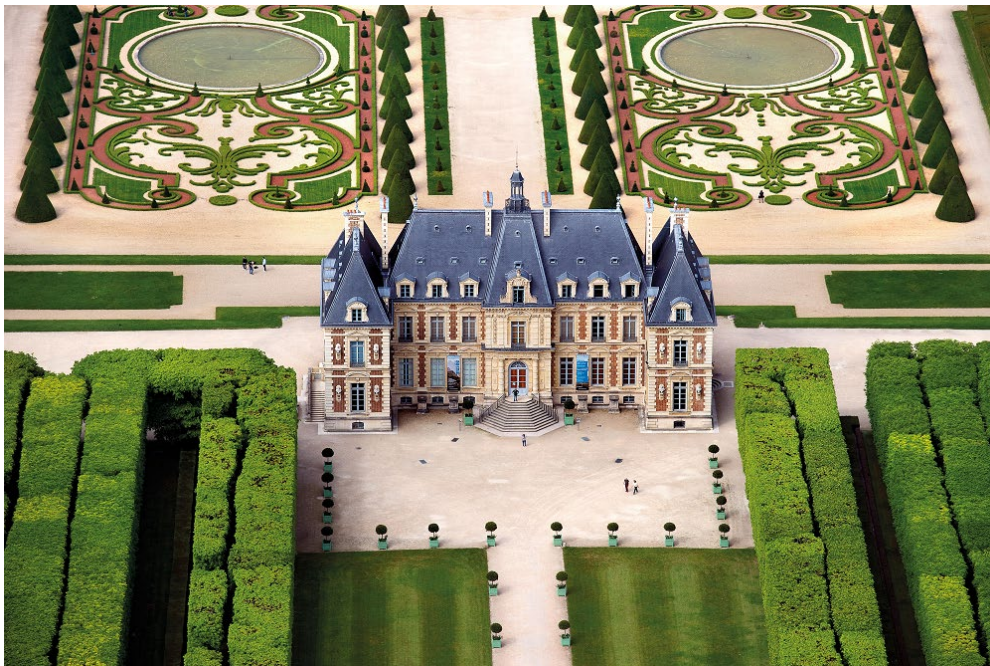
Château du Domaine départemental de Sceaux

Conférence, spectacle, ateliers, jeux, conte musical : pour leur 7 e édition, les Grandes Heures de Sceaux explorent le sujet de l'exposition Allegoria, les clés de la symbolique baroque , organisée dans les Anciennes Écuries du Domaine départemental jusqu'au 14 janvier 2024.