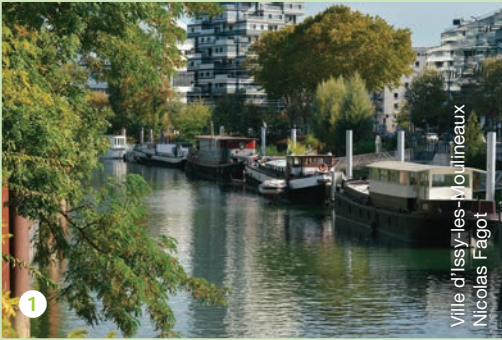
Ville d'Issy-les-Moulineaux Nicolas Fagot